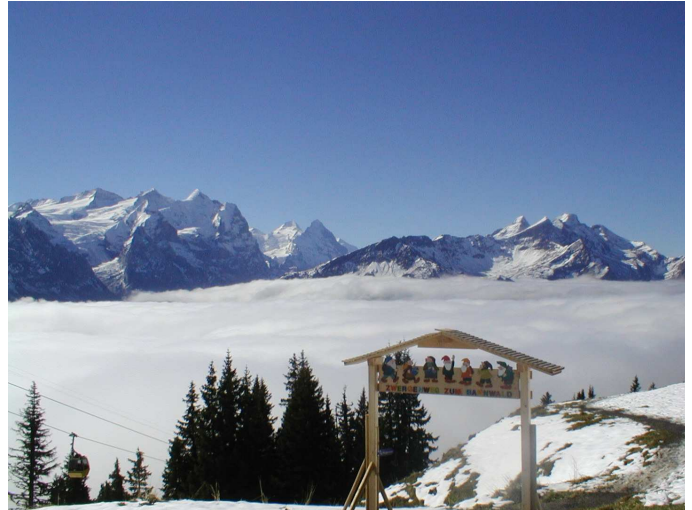
Käserstatt: Einstieg zum Muggestutzweg