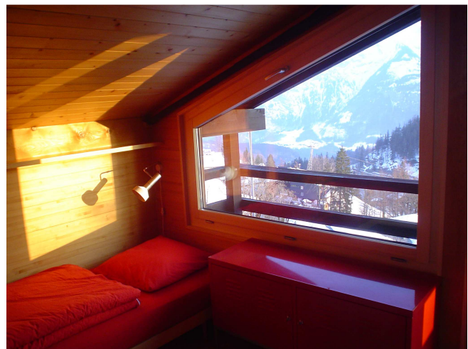
Das „rote“ Zimmer