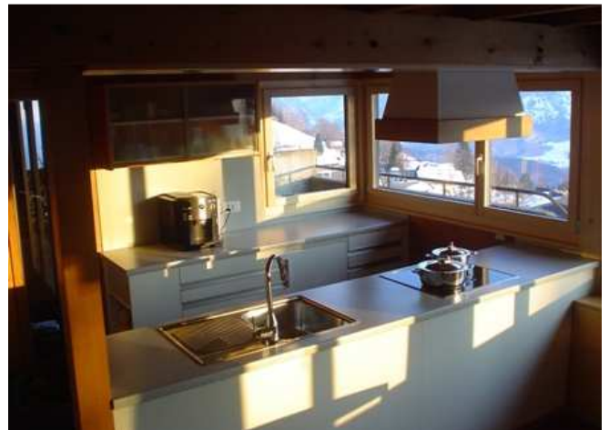
Die neue Küche

Das Cheminéeholz steht gratis zur Verfügung. Angefeuert wird mit biologischen Anzündwürfeln oder ganz wenig Zeitungspapier.