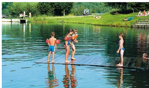
Badesee, Eröffnung im Sommer 2008

Der Hasliberg eignet sich Sommer und Winter sehr gut für Familien mit Kindern. Das Wintersportgebiet (Skihäsiland mit Schneesportschule für Kinder und Erwachsene) oder die Muggestutzerlebniswege im Sommer bieten Ihnen die Möglichkeit, unvergessliche Ferien zu geniessen und neuerdings auch im 2008 erstellten Badesee zu baden oder im angegliederten Restaurant gemütlich zu verweilen. Sonnenschirme können vor Ort gemietet werden.