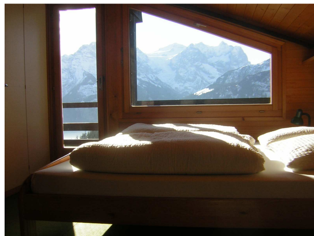
Schlafzimmer mit Blick zur Wetterhorngruppe