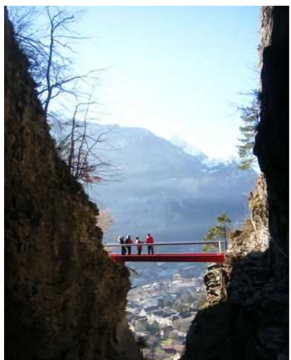
Alpbachschlucht: Weg eröffnet 2008: Schwindelfreiheit gefordert!