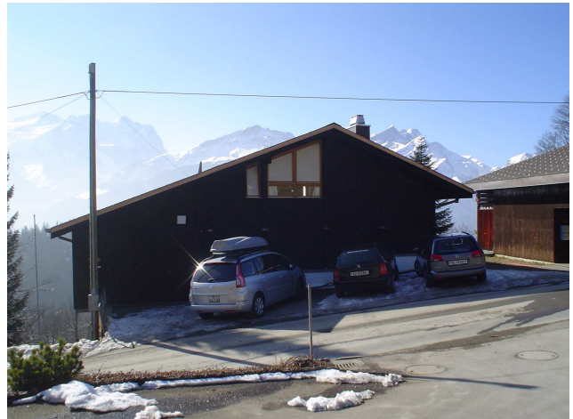
Parkplätze vor dem Haus

Kann man in der Nähe Ski- und Snowboardausrüstungen mieten ? Bei der Talstation der Luftseilbahn Twing-Käserstatt vermiehet Fahner-Sport Topmaterial.