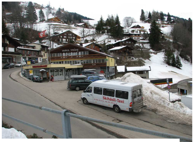
Käserstattbahn: Talstation Twing