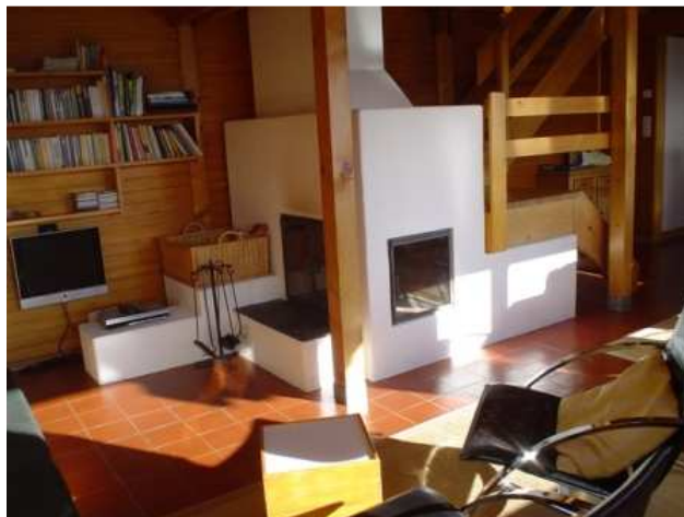
Wohnbereich mit Cheminée und Sitzgruppe