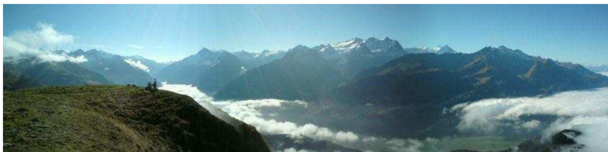
Aussicht vom Gibel: Wanderung 3.5h, hin und zurück, direkt vom Haus aus